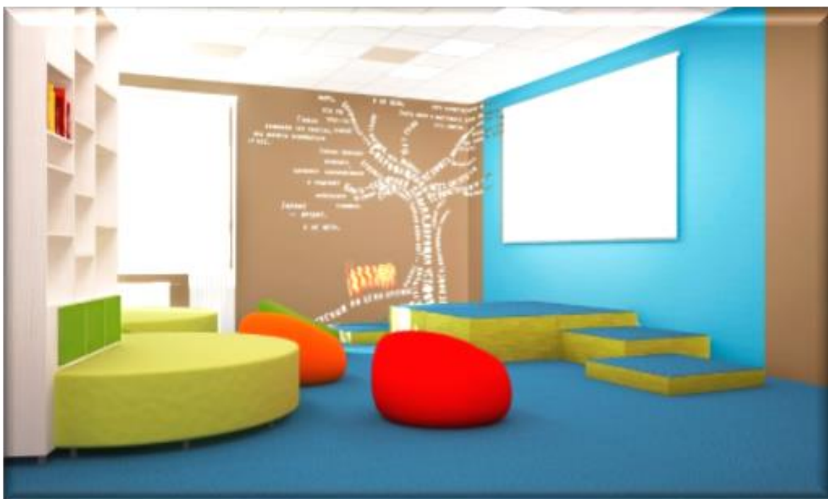
Рис. 4. Зона свободного чтения, обеспечивающая свободный доступ к информационным и образовательным ресурсам.